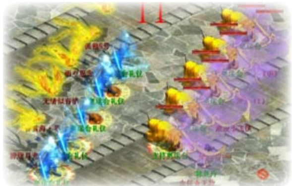
大话六周年，迎接中国奥运